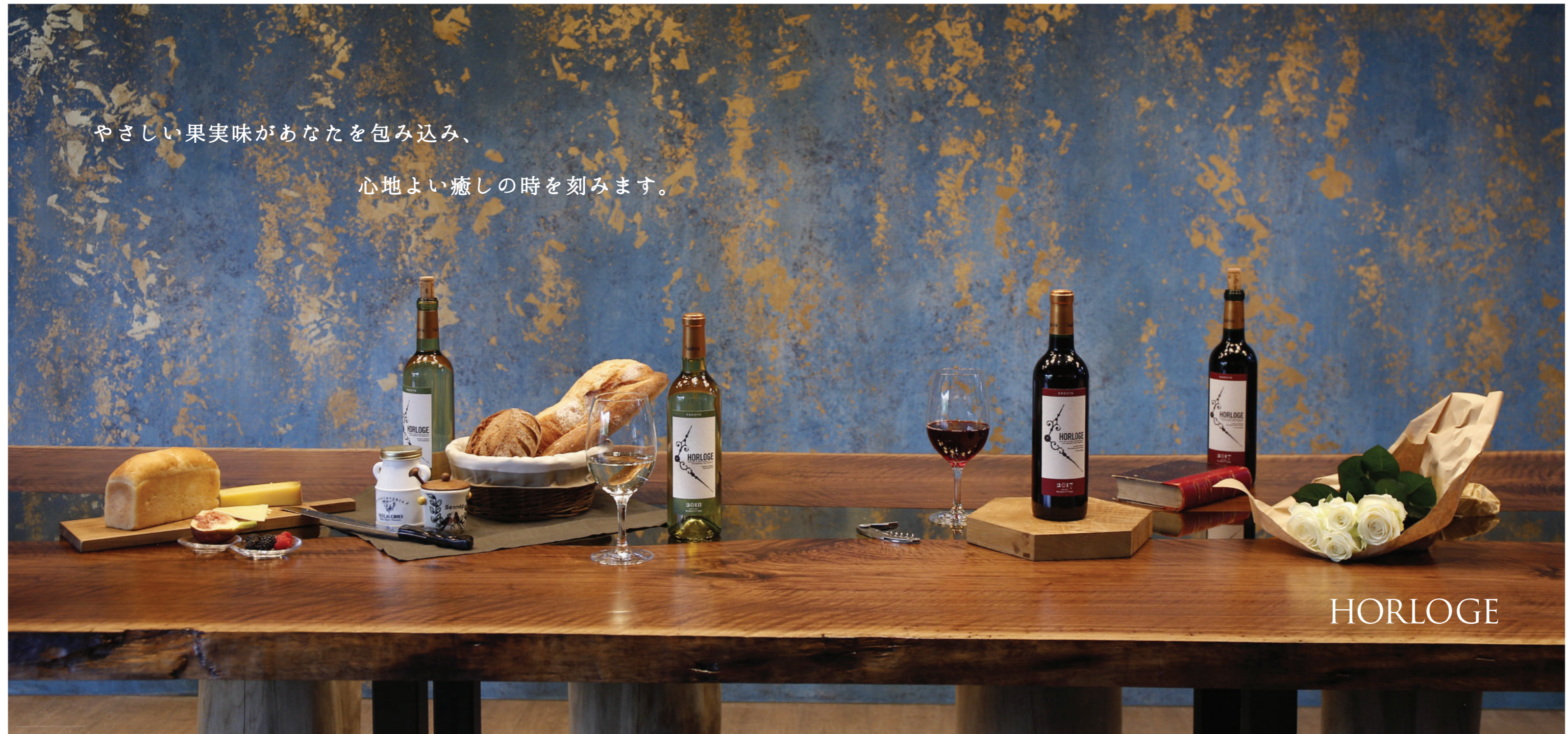
※写真は旧バージョンとなります。